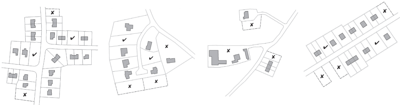
Ffigur 2 - Datblygiad mewnlenni - Enghreifftiau o leoliadau derbyniol ac annerbyniol

Sylwer: Byddai'n rhaid i'r lleoliadau derbyniol fod yn dderbyniol o hyd mewn perthynas ag ystyriaethau cynllunio arferol eraill