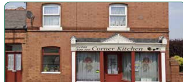
Cod Dylunio i Shotton

Mae canol tref Shotton yn gyrchfan allweddol fel y brif ganolfan siopa a gwasanaethau i'r gymuned leol a'r gymuned ehangach. Mae gan ganol y dref rai o'r adeiladau treftadaeth ac amlwg allweddol o fewn y dref. Fodd bynnag, mae'r canol yn dioddef o ddiffyg cymeriad cyffredinol a strydlun ddryslud yr olwg, gan arwain at fod yr asedau allweddol hyn yn mynd ar goll o fewn y stryd. Mae cyfle i greu canol tref cydnaws ac unedig sy'n hyrwyddo anghenion y busnesau a'r bobl sy'n ei ddefnyddio. Bydd hyn yn cynnwys creu amgylchedd mwy cyfeillgar i gerddwyr, annog mwy o weithgarwch trwy seddau a manau ymestyn allan, gwella ansawdd yr amgylchedd a chreu lle mwy cymdeithasol.