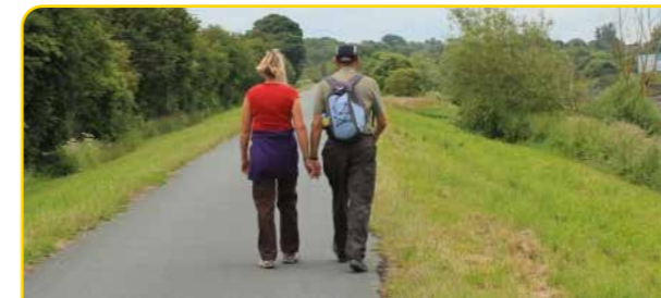
Croesffordd o Gysylltedd

Un nod allweddol yw troi'r B5129 o fod yn ffordd i stryd, ac yn lle, gyda'i gymeriad ei hun sy'n adlewyrchu Shotton, ei hanes a'i ddyfodol. Rhan o'r Cod Dylunio hwn hefyd fydd helpu i greu strydlun a chymeriad ystyrllon, trwy ddefnyddio ei deunyddiau, tirlunio ac egwyddorion dylunio. Mae'n dadansoddiad yn dangos bod llawr cyntaf llawer o'r siopau hyn yn gyfoethog o ran dyluniad a manylder pensaernïol. Mae hyn fodd bynnag yn cael ei golli ar hyn o bryd oherwydd natur brysur y llawr gwaelod. Mae angen i'r nodweddion hyn cael eu hamlygu a'u dathlu o fewn y stryd gan ei fod yn creu cyswllt ystyrllon a phresennol â threftadaeth Shotton.