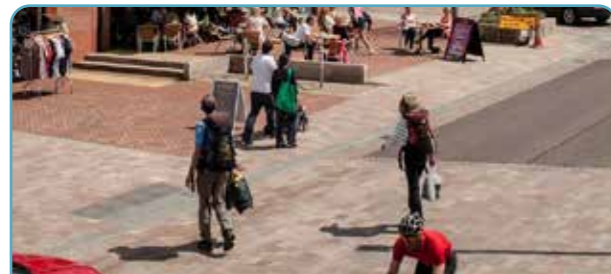
O Ffordd i Stryd

Mae canol tref Shotton yn gyrchfan allweddol fel y brif ganolfan siopa a gwasanaethau i'r gymuned leol a'r gymuned ehangach. Mae gan ganol y dref rai o'r adeiladau treftadaeth ac amlwg allweddol o fewn y dref. Fodd bynnag, mae'r canol yn dioddef o ddiffyg cymeriad cyffredinol a strydlun ddryslud yr olwg, gan arwain at fod yr asedau allweddol hyn yn mynd ar goll o fewn y stryd. Mae cyfle i greu canol tref cydnaws ac unedig sy'n hyrwyddo anghenion y busnesau a'r bobl sy'n ei ddefnyddio. Bydd hyn yn cynnwys creu amgylchedd mwy cyfeillgar i gerddwyr, annog mwy o weithgarwch trwy seddau a manau ymestyn allan, gwella ansawdd yr amgylchedd a chreu lle mwy cymdeithasol.