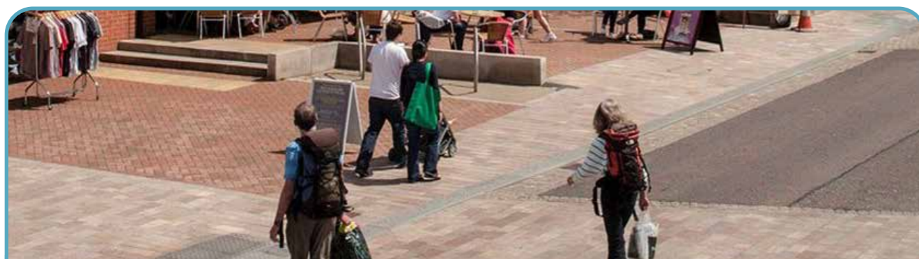
Gwella'r Ffordd Fawr (B5129) trwy Gei Connah

Mae'r B5129 yn rhedeg drwy ganol y dref, ond nid yw'n gwneud fawr ddim i gyhoeddi na dathlu'r dref. Mae'n tueddu i fod yn lle ymarferol, ond o dan oruchafiaeth ceir nad yw'n cynnig ond lleoedd cyfyngedig sydd o ansawdd uchel i bobl. Mae angen i'r stryd fod yn lle o fywyd o gweithgarwch lle mae pobl y dref yn gallu dod at ei gilydd.