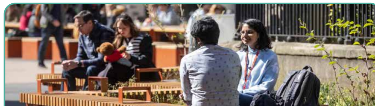
Gwella Ardal Canolfan Siopa'r Stryd Fawr

Lleoliad allweddol ar hyd y ffordd yw cyffordd Ffordd y Doc, sy'n eich arwain chi i lawr i'r Dociau. Mae pensaernïaeth Victoriaidd adeiladau cyfagos a llecynnau gwyrdd yn creu amgylchedd braf, ond gellid gwella hyn trwy gelf cyhoeddus ac arwyddion i gyfeirio pobl yn well. Dylid rhoi ystyriaeth hefyd i fynediad i feicwyr a cherddwyr rhwng y B5129, y Llwybr Beicio Cenedlaethol a Llwybr Arfordir Cymru.