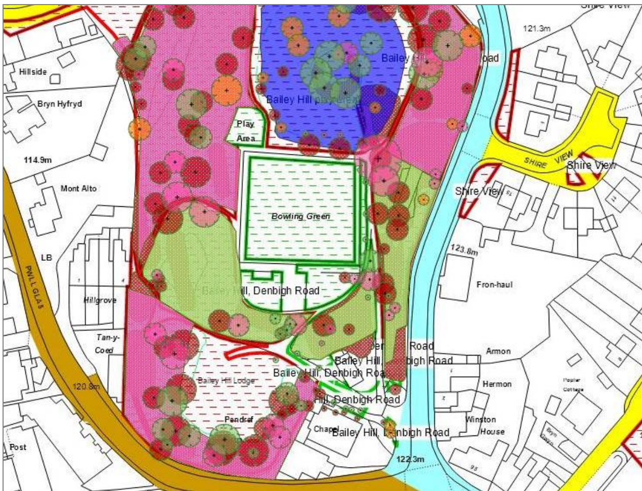
Ffigur 2 -Sgrinlun Mapio Coed Ezytreev – Bryn y Beili, yr Wyddgrug