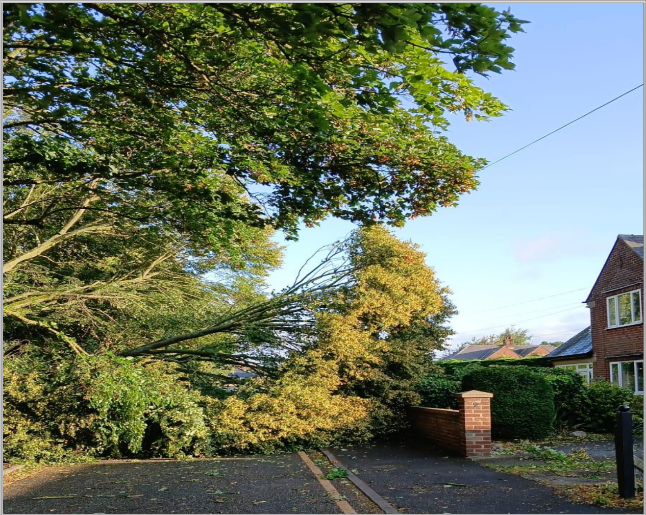
Plât 1. Darnau o goed wedi disgyn mewn Man Agored Cyhoeddus Trefol

8.3.1 Fel rhan o'r Gwasanaeth Mynediad a'r Amgylchedd Naturiol, mae coedwyr y Cyngor yn archwilio a chynnal coed ar Fannau Agored Cyhoeddus Trefol yn uniongyrchol, sy'n cwmpasu ardal o bron i 200ha. Caiff Mannau Agored Cyhoeddus Trefol eu categoreiddio fel parthau Deiliadaeth Ganolig (Gweler Tabl 1) a chynhelir PAI bob pum mlynedd, ar wahân i rywogaethau ynn ( Fraxinus spp. ), a gaiff eu harchwilio bob blwyddyn oherwydd clefyd coed ynn, yn unol â 6.3 uchod. Caiff gwaith coed ei flaenoriaethu, ei drefnu a'i gwblhau yn ôl lefel y risg.