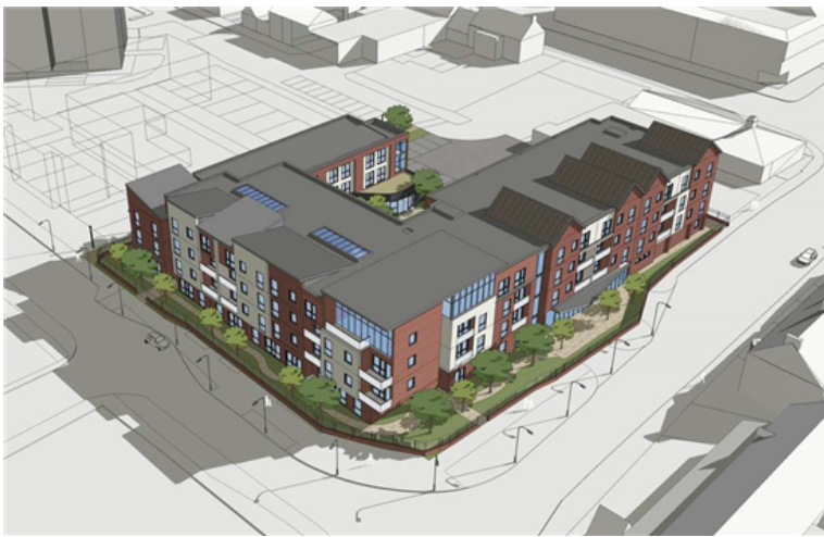
Argraffiad artist o'r Tai Gofal Ychwanegol i bobl hŷn a gynllunir ar gyfer y Fflint.

Gall unrhyw un sydd am gofrestru i gael pecyn gwybodaeth am y fflatiau newydd gysylltu â Chymdeithas Tai Clwyd Alyn ar 01745 538300 neu e-bostio enquiries@clwydalyn.co.uk