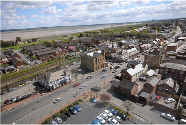
Yr olygfa o Richard Heights yn y Fflint

"Mae hwn yn gyfnod eithriadol o gyffrous ym maes tai yng Nghyngor Sir y Fflint. Mae'r cynllun pwysig hwn yn dangos ymrwymiad y Cyngor i'n tenantiaid, ein tai Cyngor ac i sicrhau ein bod yn cyrraedd Safon Ansawdd Tai Cymru cyn pen terfyn amser Llywodraeth Cymru."