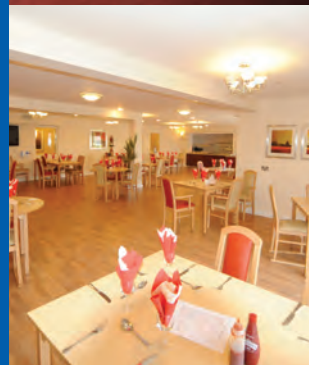
FFLAT 2 YSTAFELL WELY 696 tr sgwâr