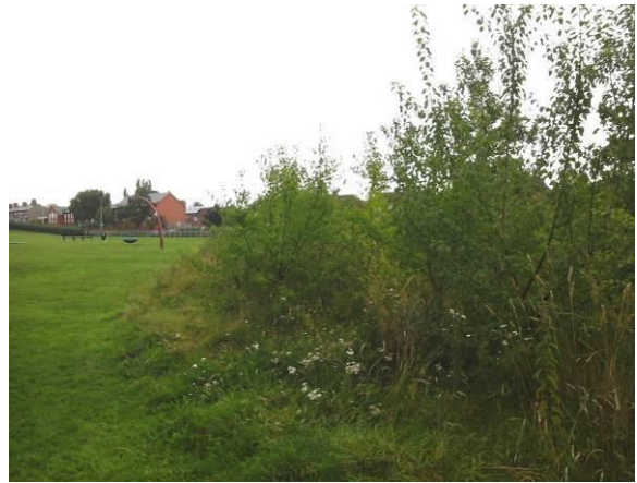
Llun 3. Coed ifanc a blannwyd yn The Willows, yr Hôb, wedi'i gategoreiddio fel man agored ffurfiol

I gynorthwyo â chreu gorchudd coed gwydn ac amrywiol, bydd rhywogaethau llai cyffredin o goed yn cael eu plannu. Bydd y rhywogaethau llai cyffredin hyn hefyd yn fwy diddorol ac ni fyddant yn edrych yn od mewn tirlun mwy ffurfiol. Mewn mannau agored ffurfiol, mae gorddibyniaeth ar goed ar eu llawn dwf a hen goed i ddarparu gorchudd a byddai plannu coed newydd yn arwain at goed o oed a maint mwy amrywiol.