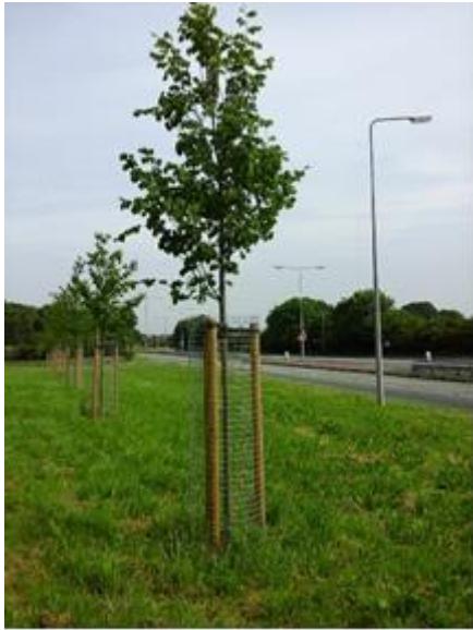
Llun 5. Plannu ar ymyl ffordd meddal