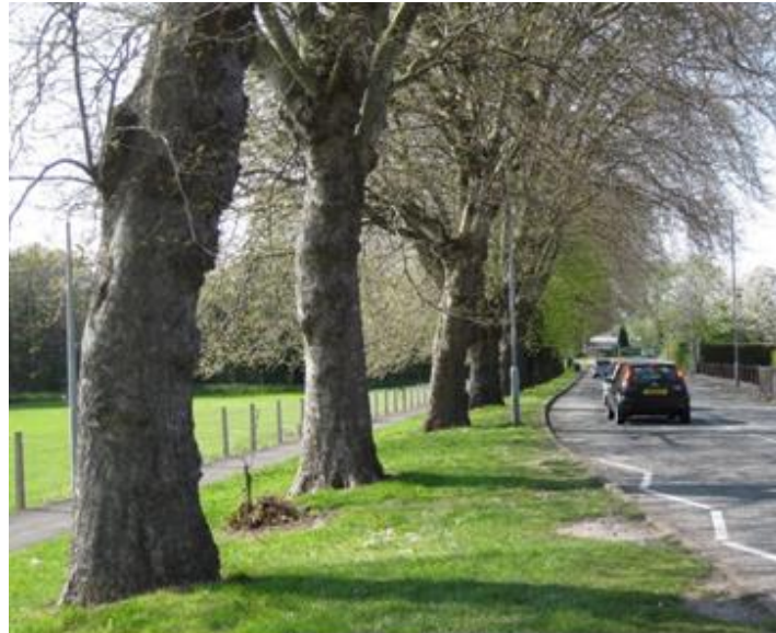
Llun 6. Coed llawn-dwf ar ochr y briffordd yn y Fflint

Mae plannu yn y pafin ar strydoedd yn dechnegol heriol ac mae angen ymgynghori gyda nifer o fudd-ddeiliaid (e.e. peirianwyr priffyrdd, darparwyr cyfleustodau, gweithwyr tirlunio a gweithwyr coed). Rhaid i waith plannu fodloni safonau priffyrdd a chreu amodau addas i goed dyfu. Er hynny, gall plannu coed ar strydoedd fod yn effeithiol iawn i wella ansawdd y parth cyhoeddus. Oherwydd ei fod yn eithaf costus, mae gwaith plannu mewn pafin fel arfer yn cael ei wneud yn rhan o gynlluniau adfywio sydd wedi'u hariannu'n allanol.