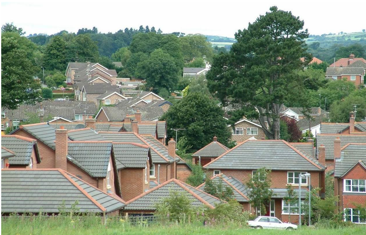
Llun 11. Gorchudd coed trefol yr Wyddgrug

Roedd y dull traddodiadol o reoli coed yn edrych ar goeden unigol a'r hyn roedd ei angen i ddatrys problem neu fater penodol. Nid oedd y dull traddodiadol yn strategol ac nid oedd y gorchudd coed yn cael ei fesur, felly roedd ansicrwydd a oedd yn gynaliadwy. Roedd dyfodiad mudiad coedwigaeth drefol yn cydnabod bod yr adnodd coedwig drefol cyfan yn llawer mwy na'r rhannau unigol gyda'i gilydd a'i fod yn adnodd i bawb sydd â gwerth ariannol. I reoli gorchudd coed trefol yn gynaliadwy, bydd angen i'r Cyngor fabwysiadu dull modern (Tabl 9).