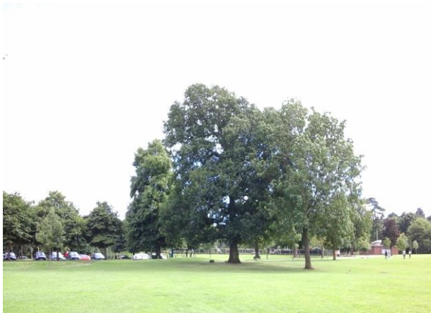
Llun 2. Coed llawn-dwf a thir parc ym Mharc Gwepira sydd wedi'i gategoreiddio fel man agored ffurfiol

I wella bioamrywiaeth, mae cyfle hefyd i hau blodau gwyllt ger y coed lle nad yw'r glaswellt yn cael ei dorri mor aml yn rhan o ddulliau rheoli mannau agored diwygiedig.