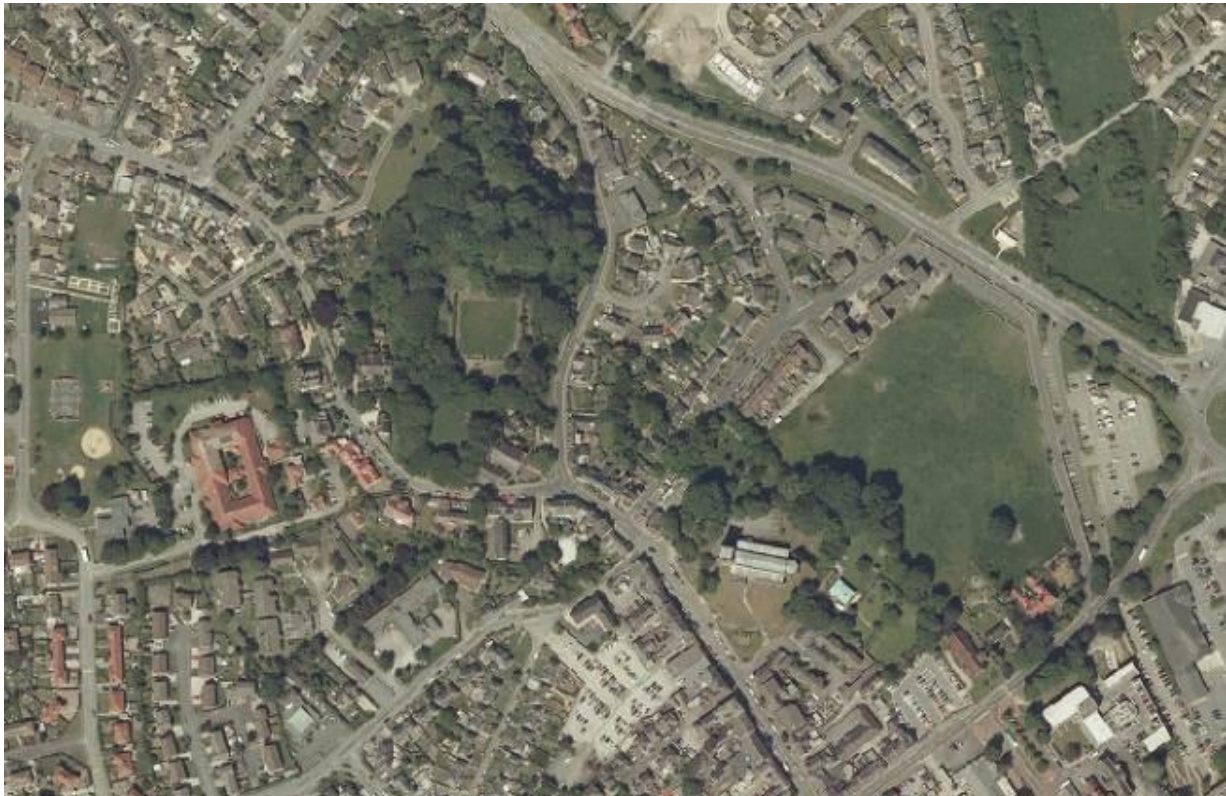
Llun 1. Llun o'r awyr o'r Wyddgrug yn 2009

Roedd astudiaeth o 2016 12 a gyhoeddwyd gan Gyfoeth Naturiol Cymru y edrych ar orchudd coed yn nhrefi a dinasoedd Cymru. Mae gorchudd coed mewn trefi'n cael ei gyfrif fel faint o dir mewn trefi sydd dan orchudd coed neu goetir a gwasgariad y tir hwnnw wrth ei asesu gan ddefnyddio ffotograffau o'r awyr. Yr astudiaeth oedd yr arolwg cenedlaethol cyntaf o'i fath yn y byd a bu iddo ganfod bod cyfartaledd o 16.3% o orchudd coed yng Nghymru yn 2013, a oedd yn is na 17% mewn arolwg blaenorol yn 2009.