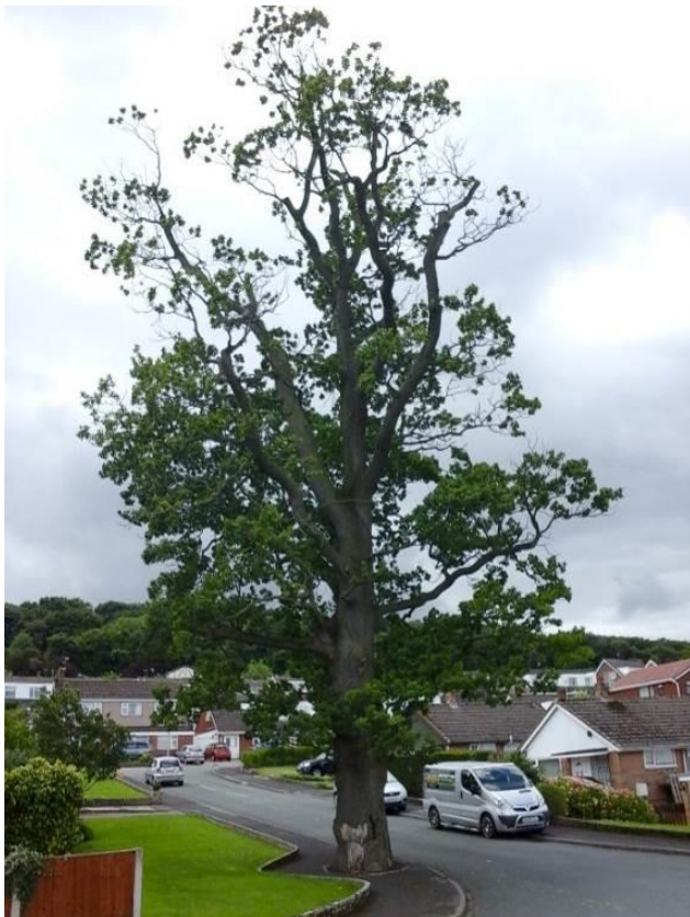
Llun 12. Derwen llawn-dwf yn dirywio sy'n cael ei harchwilio'n aml

Mae'r risg o farw neu gael anaf o ganlyniad i goeden yn disgyn yn aml yn cael ei chwyddo. Credir bod hyn oherwydd bod gormod o adroddiadau am achosion o'r fath yn y cyfryngau, a hynny, debyg, gan eu bod yn cael eu hystyried yn ddamweiniau anghyffredin ac yn deilwng o fod ar y newyddion 37 . Yn ôl yr ystadegau, mae'r risg o gael eich lladd gan goeden neu gangen sy'n disgyn sydd mewn ardal sy'n cael ei defnyddio gan y cyhoedd yn hynod o isel 38 .