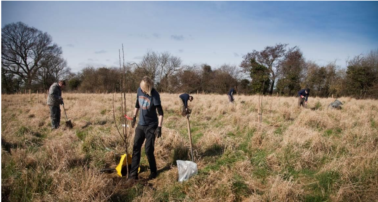
Llun 14. Gwirfoddolwyr yn plannu coed perllan yn Llwyni ar gyrion Cei Connah.

Bydd partneriaid i gyflawni'r cynllun yn cynnwys cyngorau tref a chymuned a gallai Coed Cadw hefyd fod yn bartneriaid. Mae'r Gwasanaeth Cefn Gwlad eisoes wedi creu partneriaethau gwaith da ac mae'n rheoli coetir yng Nghastell Caergwrle ar ran y cyngor cymuned.